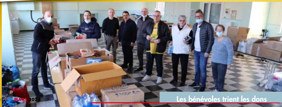
Les bénévoles trient les dons