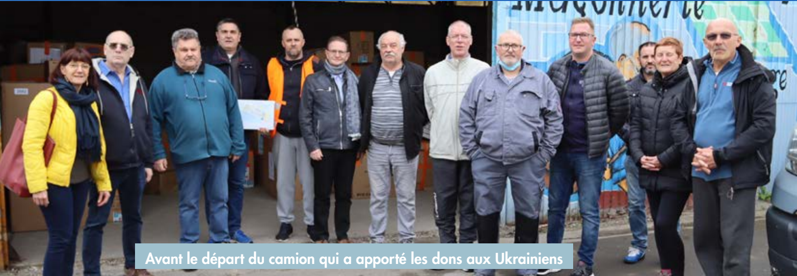
Avant le départ du camion qui a apporté les dons aux Ukrainiens