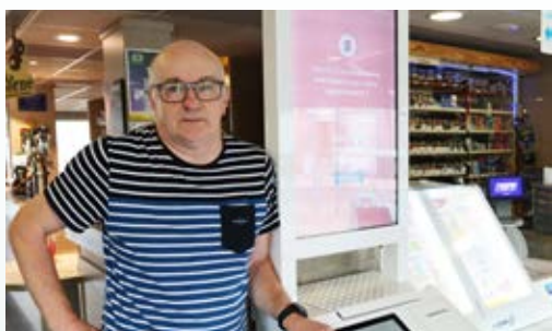
CAFE DE L'AVENUE