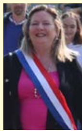
Michelle Gréaume, Sénatrice du Nord est intervenue en séance publique du Sénat.

Secrétaire générale de la CGT à VALDUNES le vendredi 1 septembre. Réunion publique à la salle des Fêtes à 18h.