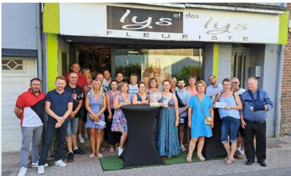
UN COMMUNIQUÉ DE L'UCAL