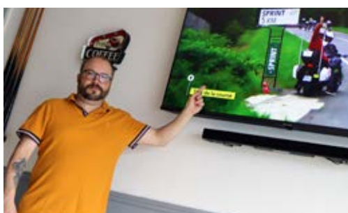
LE CAFE DU CENTRE