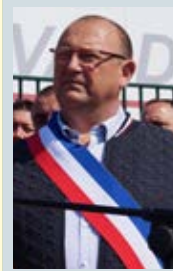
Motion votée par le conseil municipal au cours de sa séance du 5 juin 2023

« Dernière entreprise française à fabriquer des roues et essieux pour le ferroviaire et le matériel roulant, l'entreprise Valdunes est menacée de fermeture suite au désengagement de l'unique actionnaire, le chinois MA Steel. 368 salariés, au savoir-faire reconnu - comme a pu le constater votre collègue Roland Lescure, ministre de l'Industrie, lors de sa venue sur place - sont menacés de licenciements sur les deux sites nordistes de Trith-Saint-Léger et Leffrinckoucke, quand on sait que la suppression d'un emploi industriel entraîne la perte de trois emplois induits, on mesure l'ampleur des conséquences, aux plans humain et industriel... La mobilisation des salariés, des élus et de la population a déjà fait bouger les lignes, dans le sens où l'activité devrait être maintenue jusqu'à la fin de cette année, laissant ainsi du temps pour trouver un repreneur. Mais plus qu'un repreneur, Madame la Ministre, le vrai sujet est : pour quel projet industriel ?... Le retrait de MA Steel offre l'opportunité de changer d'orientation et de reprendre la main sur cet outil stratégique pour notre indépendance industrielle et la transition écologique. La reconquête des marchés SNCF, RATP, Alstom, entreprises publiques ou bénéficiant très largement de fonds publics, est une priorité... » En réponse à cette interpellation, le gouvernement a rappelé les engagements formulés par monsieur le Ministre de l'industrie lors de sa venue sur le site de l'usine trithoise.