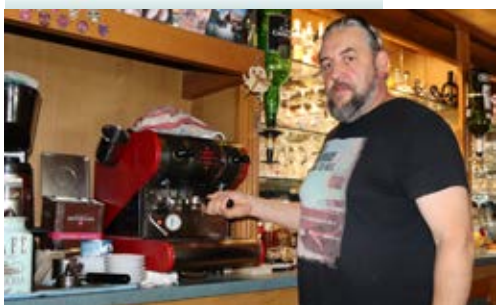
CAFE 2 LA PLACE

Figurent dans cette page les commerçants ou artisans ayant donné leur accord pour y figurer. Les artisans, commerçants, auto-entrepreneurs n'étant pas encore référencés peuvent se faire connaître en mairie au 0327237500.